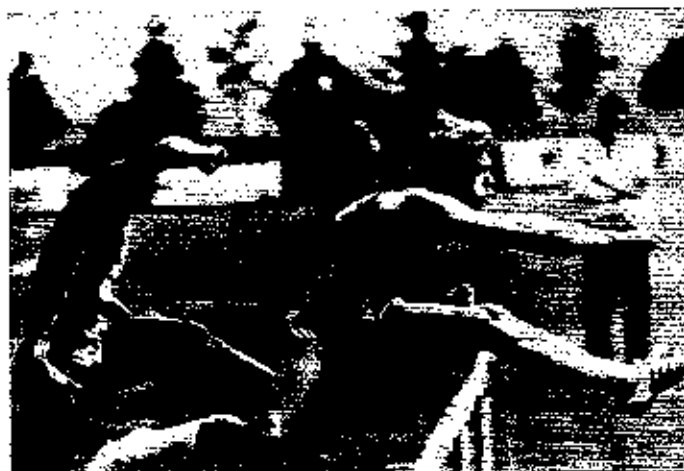
Guido Kratschmer war in 14,16 Schnellster über 110 m Hürden vor Daley Thompson 14,37.

Die herausragenden Athleten des Zehnkampfes waren der Europarekordmann und Olympiazweite von 1976 Guido Kratschmer/BRD (Europarekord 8498e Punkte) und der stets zu Späßen aufgelegte Brite Daley Thompson, dessen Bestleistung 8467e Punkte (allerdings mit mehr als 4 m/sec. Rückenwind beim 8,11-m-Weitsprung) bzw. 8289e Punkte (damit Vize-Europameister 1976) gelautet hatte. Sie trafen auf zehn weitere 8000-P.-Zehnkämpfer: Jürgen Hingsen/RBD (8240e Punkte, Junioren-EM-Dritter 1977), Sepp Zellbauer/O (8198e Punkte, Olympianeunter 1972, EM-Fünfter 1971, EM-Siebenter 1974, EM-Vierter 1978, dreifacher Universitätsieger!), Waleri Katschanow/SU (8134e Punkte), Johannes Lahti/Fi (8102e Punkte, Olympiazweiter 1976, EM-Siebenter 1978), Juri Kuzenko/SU (8086e Punkte, EM-Fünfter 1978), Holger Schmidt/BRD (8079e Punkte, EM-Neunter 1978), Aleksandr Nowski/SU (8057e Punkte), Mauricio Bardales/USA (8054e Punkte) Dariusz Ludwig/Pol (8049e Punkte) und Jens Schulte/BRD (8018e Punkte, Junioren-EM-Fünfter 1975). Aus Österreich gingen beim Zehnkampf weiters an den Start: Georg Werthner (7824e Punkte, Junioren-EM-Zweiter 1975), Roland Werthner (7078e Punkte, gab wegen Verletzung nach 100 m in 11,90 auf) und Philipp Eder (6913e Punkte).